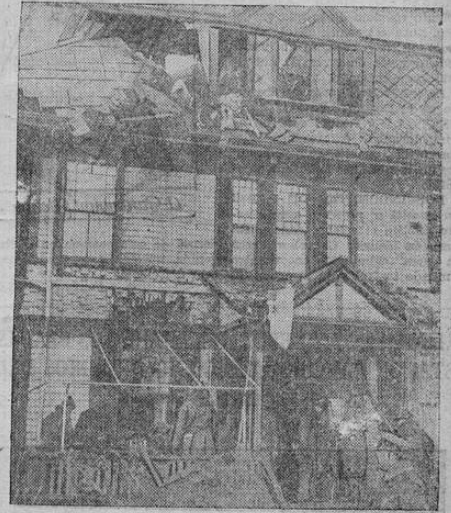
Esta casa, de madera, se incendió y en el siniestro perecieron tres personas. El hecho ocurrió en Brockton, Massachusetts