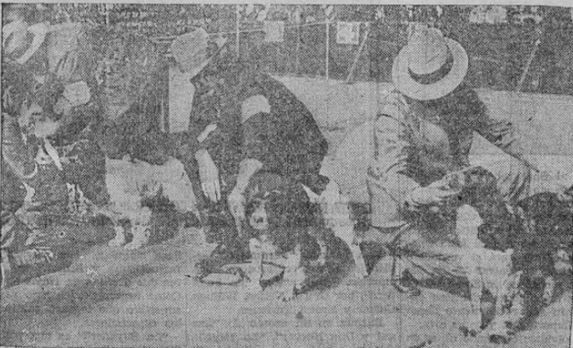
Aspecto de la reciente exposición canina, celebrada en el Madison Square Garden, Sección de perros de agua