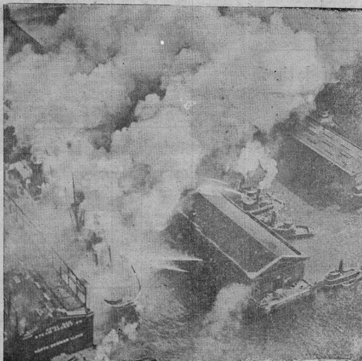
El vapor alemán MUENCHEN se incendió y hundió atracado a un muelle de Nueva York, poco después de haber llegado de Europa. La foto muestra un aspecto del incendio

Este documento es propiedad de la Biblioteca Nacional "Miguel Obregón Lizano" del Sistema Nacional de Bibliotecas del Ministerio de Cultura y Juventud, Costa Rica.