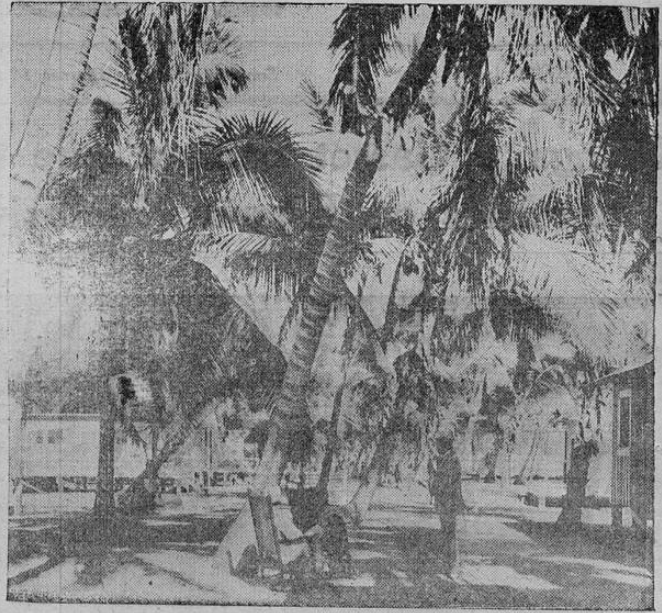
Long Key, en el extremo sur de Florida, es el bellissimo sitio en donde acaba de pasar una temposana el presidente Hoover