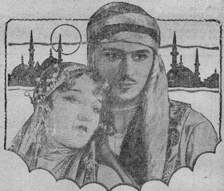
GRETA NISSEN AND WILLIAM COLLIER, JR. IN THE RAOUAL WALSH PRODUCTION "THE LADY OF THE HAREM" A PARAMOUNT PICTURE

Una película "Paramount" espléndida nos ofrece esta noche la empresa del Raventós. "La Bayadera", por Greta Nissen, William Collier y Ernest Torrence.