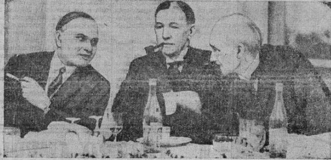
El embajador americano Dawes y su inseparable pipa pueden verse en esta foto, tomada durante un almuerzo que le fué ofrecido en Londres. Les acompañan Lord Riddell y Sir Atul Chatterjee, alto comisionado de la India